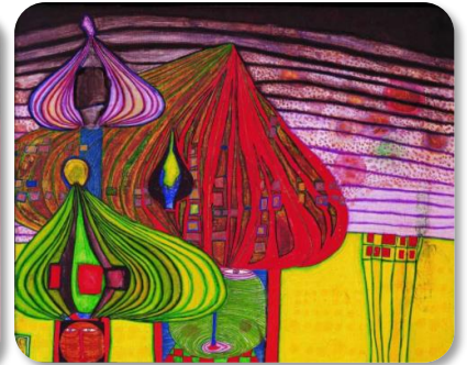
대담한 컬러와 식물학적 회화법이 독특한 미술 작품